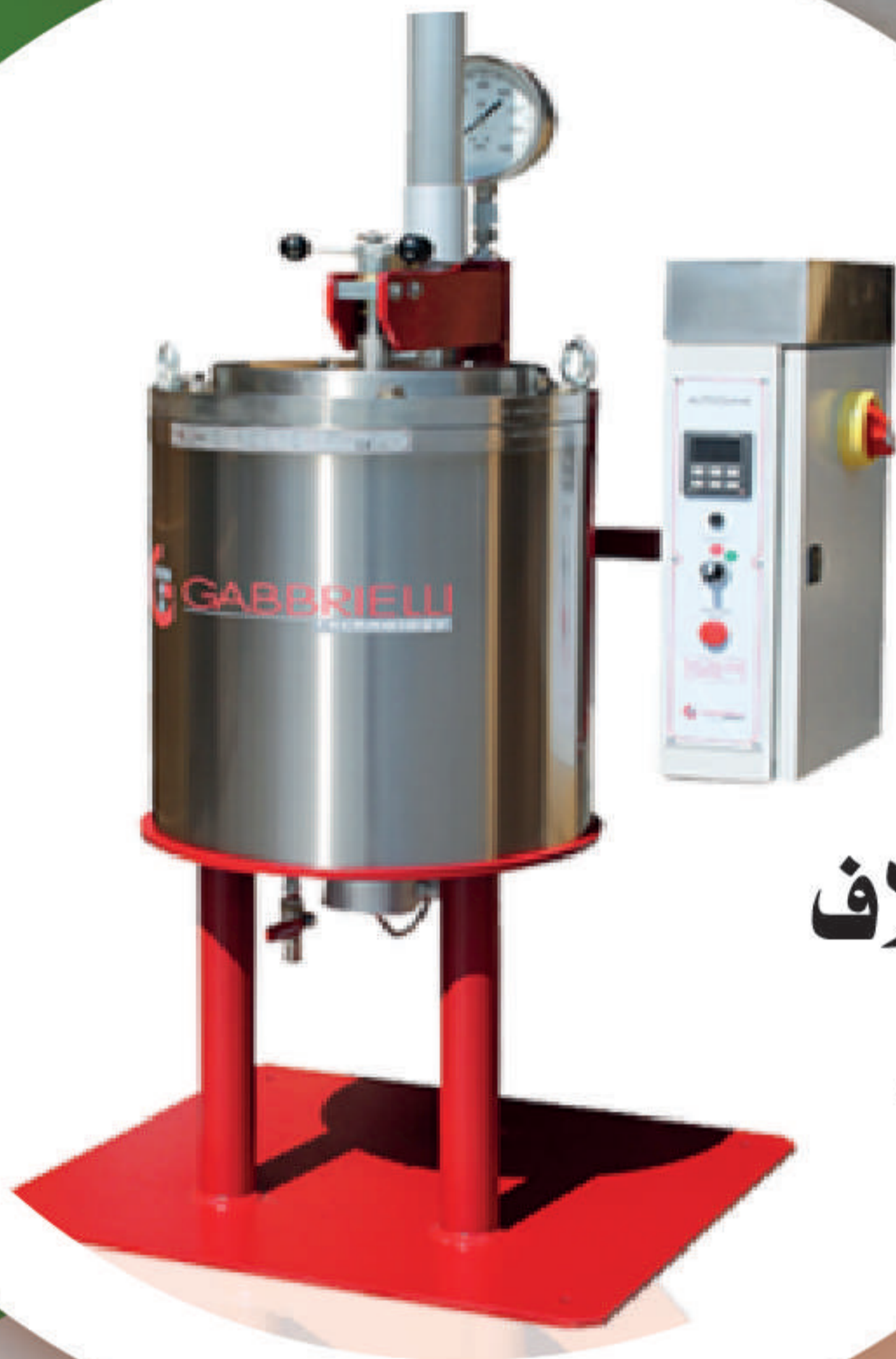
جهاز الأوتوكلاف Autoclave