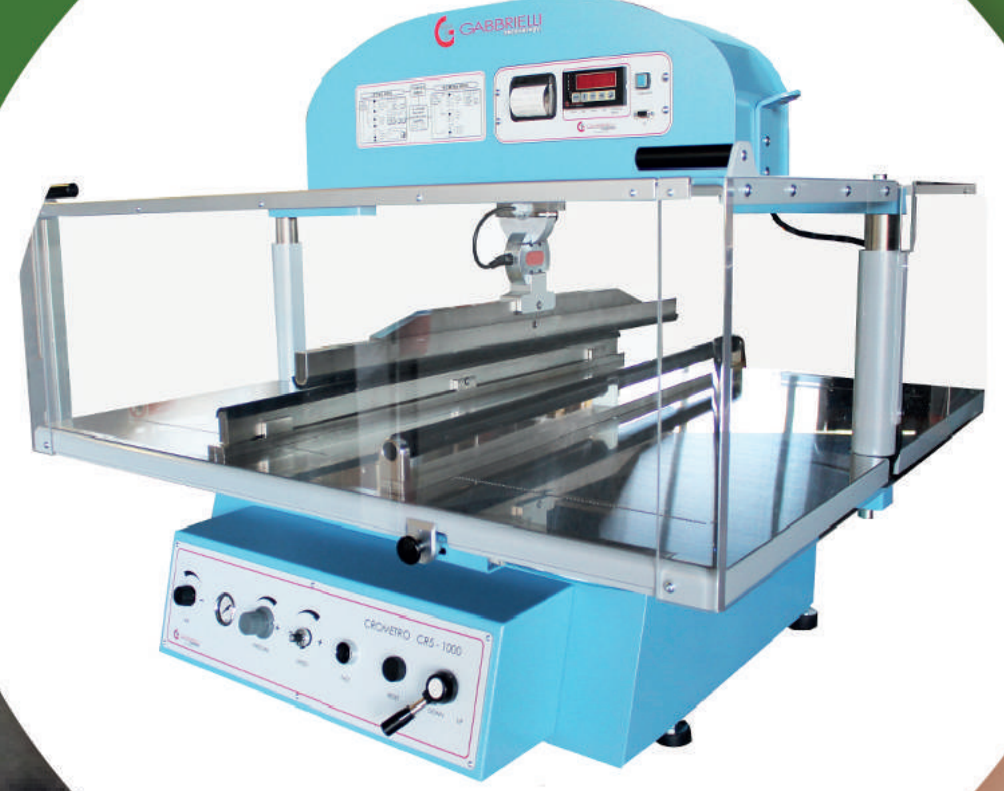
معايير الكسر بالانحناء Modulus of Rupture