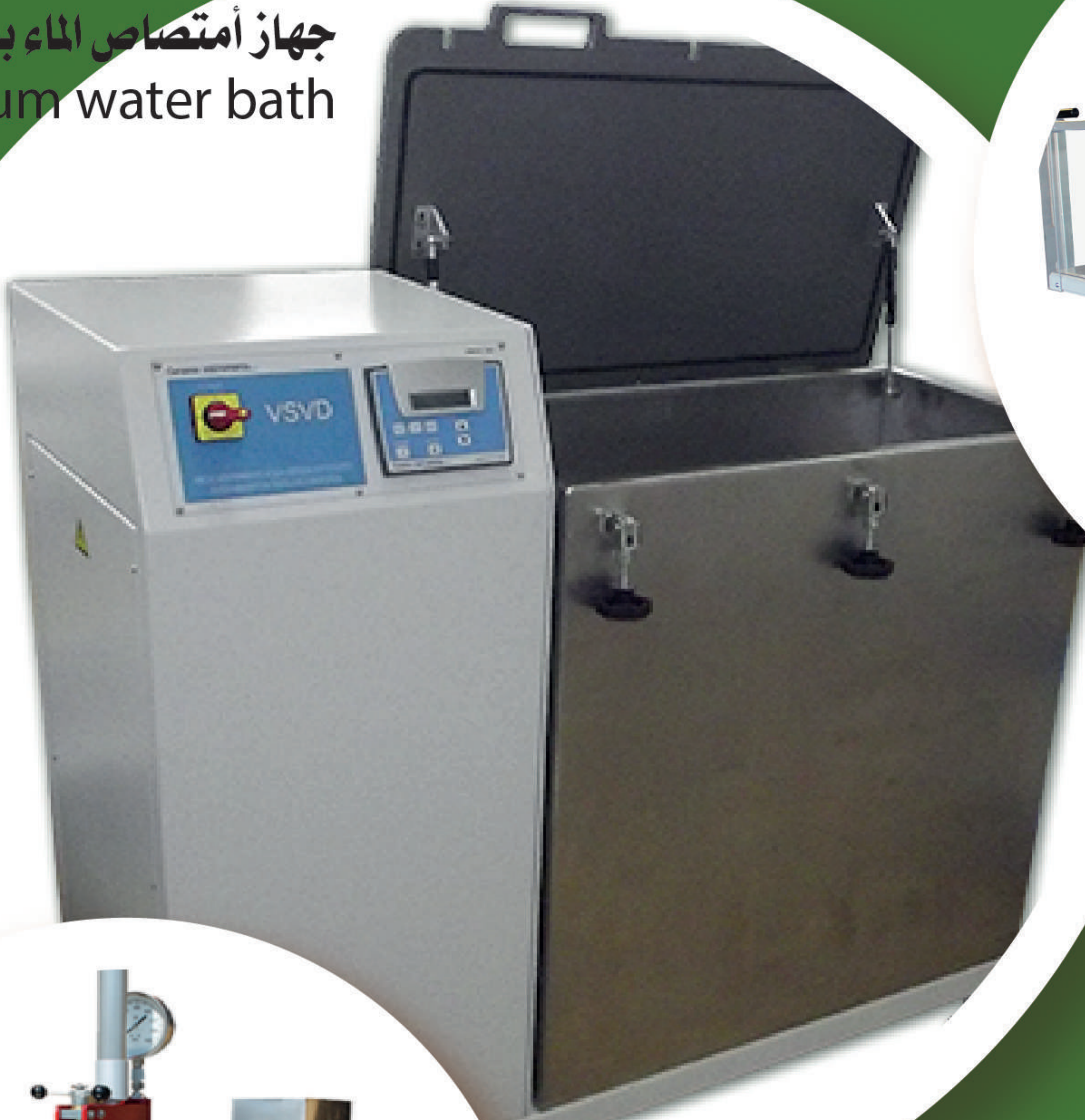
جهاز امتصاص الماء بالتفريغ Vaccum water bath

الهيئة المصرية العامة للمواصفات والجودة Egyptian Organization for Standardization and Quality